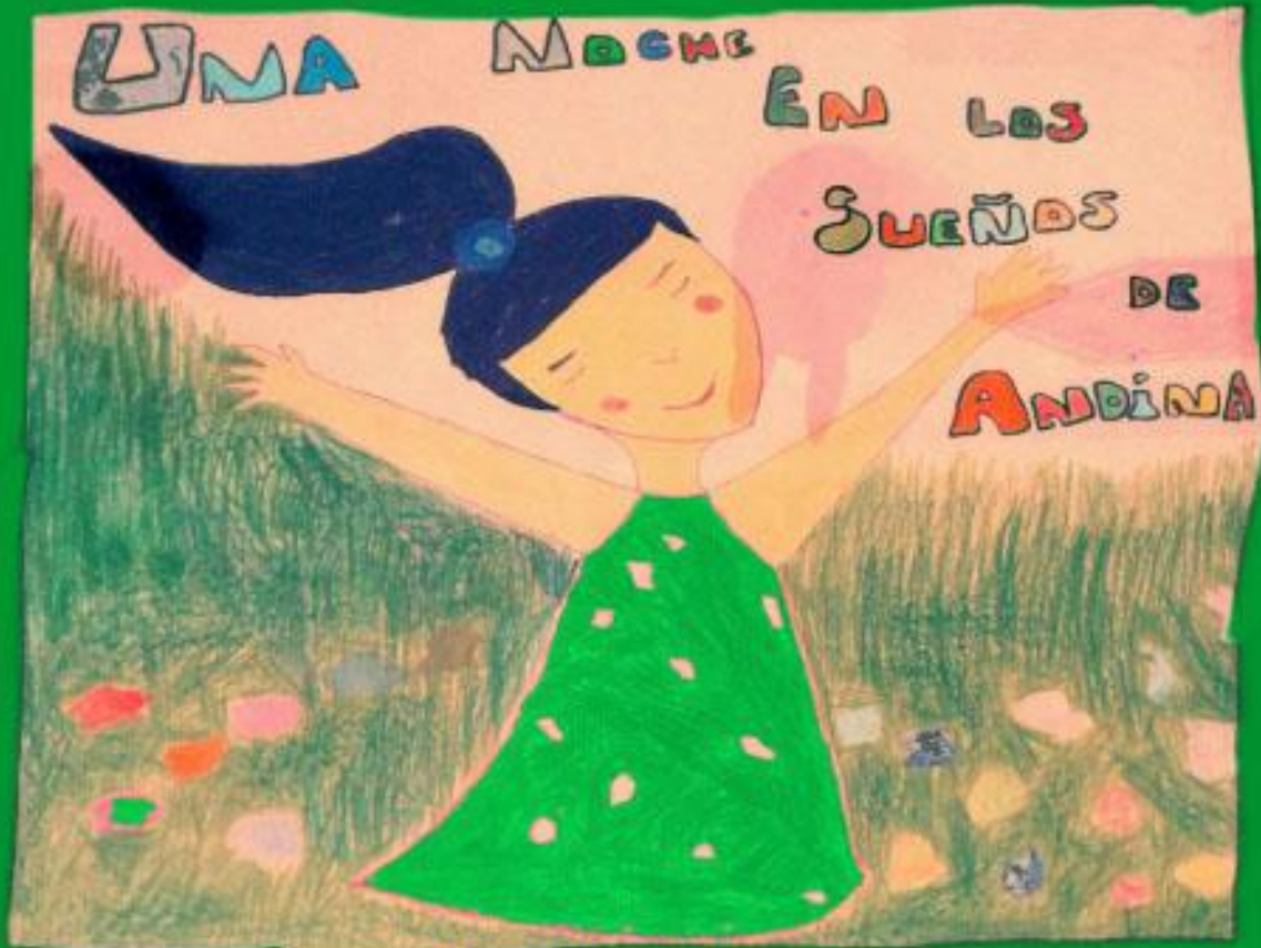
Dibujo de una alumna

Los personajes, títeres y elementos son interpretados o manipulados por l@s alumn@s del taller-espectáculo